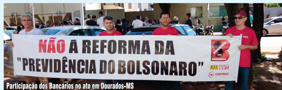
Participação dos Bancários no ato em Dourados-MS