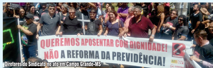
Diretores do Sindicato no ato em Campo Grande-MS