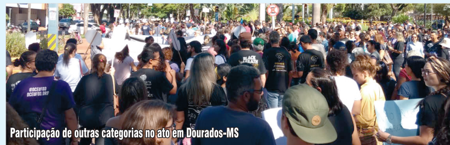
Participação de outras categorias no ato em Dourados-MS

Bancários de Dourados e Região-MS, está convocando toda a categoria e os trabalhadores em geral para participar das reuniões, atos e manifestações que ocorrerão nos próximos meses.